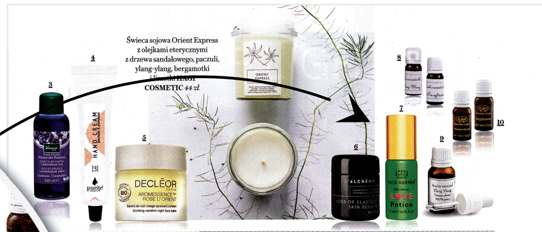
3. Świeca sojowa Orient Express z olejkami eterycznymi z drzewa sandalowego, paczuli, ylang-ylang, bergamotki i kardamonu COSMETIC 44 zł. 4. Krem do rąk Paczula & Palmarosa PURITE 50 g/47 zł. 5. Balsam na noc z olejkami z róży damasceńskiej Harmonie Calm Organic DECLÉOR 15 ml/164 zł. 6. Przeciwstarzeniowy krem do cery suchej i wrażliwej nr 709 D'ALCHÉMY 50 ml/170 zł. 7. Mieszanka dziesięciu olejków eterycznych znanych jako najsilniejsze afrodyzjaki Love Potion TATA HARPER 5 ml/207 zł (warsztatpielna.pl). 8. Olejki eteryczne paczulowy oraz sosnowy L'ORIENT 7 ml/19,50 zł i 7 ml/17 zł. 9. Olejek eteryczny Ylang-Ylang CV PRIMARY 15 ml/184 zł (alchemiawody.pl). 10. Olejki eteryczne mandarynkowy oraz grejpfrutowy DR BETA 9 ml/13,11 zł i 9 ml/19,77 (drbeta.pl).