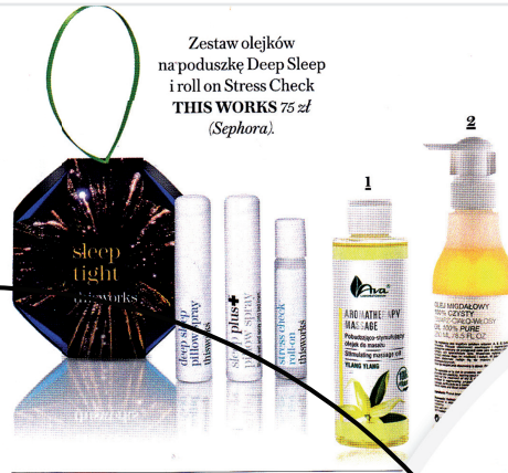
Zestaw olejków na poduszkę Deep Sleep i roll on Stress Check THIS WORKS 75 zł (Sephora).