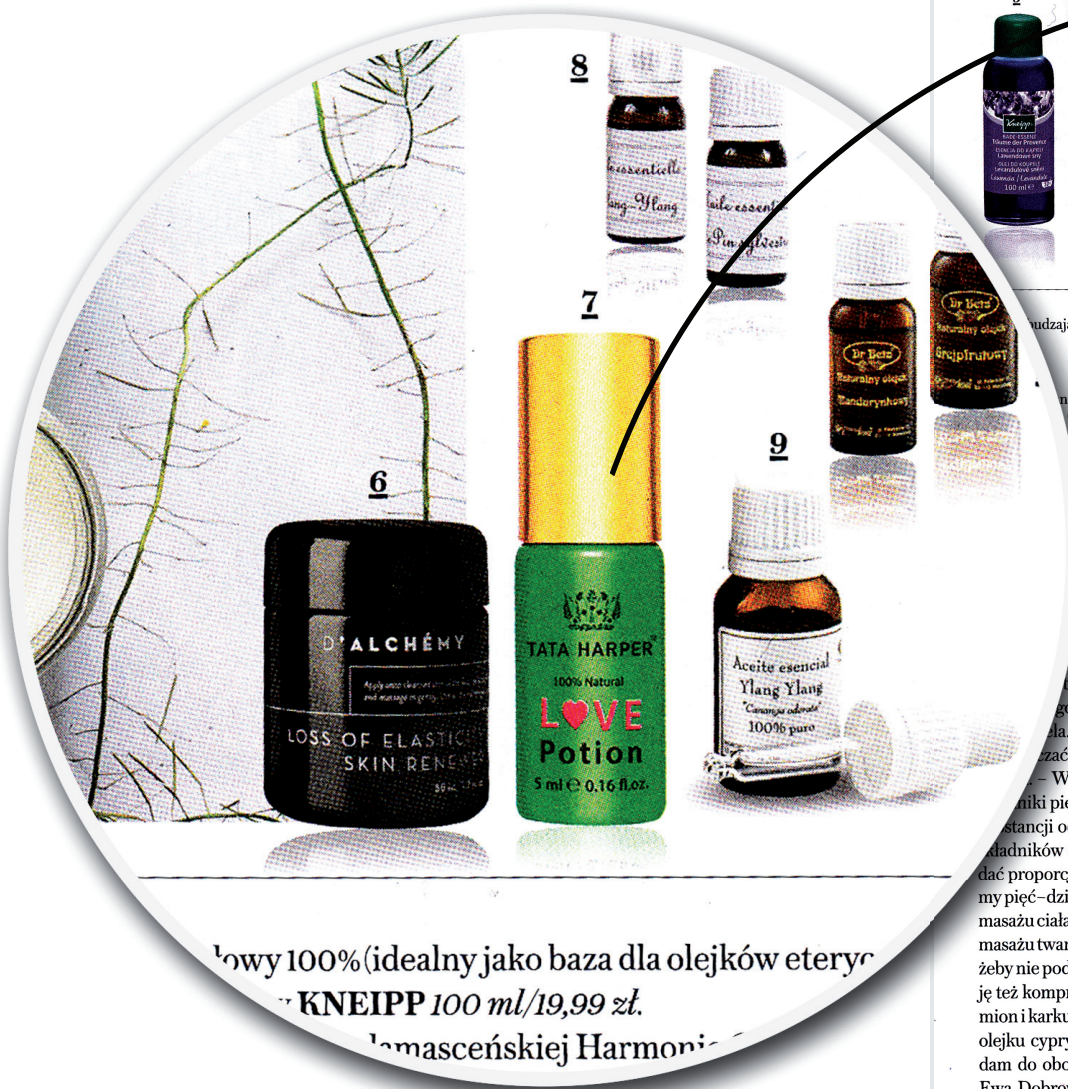
1. Olej migdałowy 100% (idealny jako baza dla olejków eterycznych) KNEIPP 100 ml/19,99 zł. 2. Olej eteryczny Ylang-Ylang z damasceńskiej Harmonii