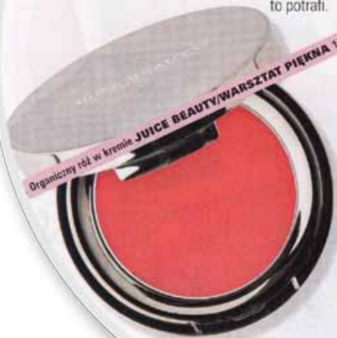
Organiczny róż w kremie JUICE BEAUTY/WARSZTAT PIĘKNA 172 zł