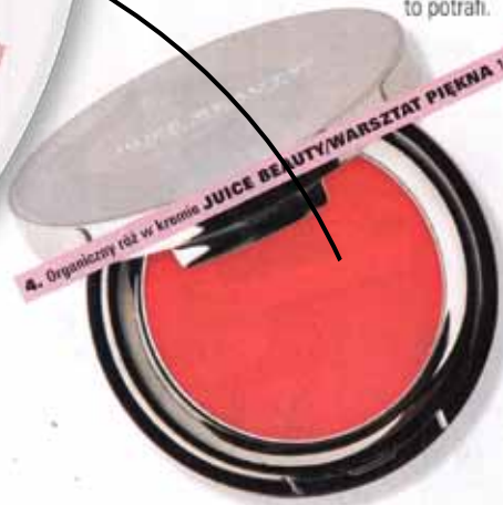
4. Organiczny róż w kremie JUICE BEAUTY/WARSZTAT PIĘKNA 172 zł