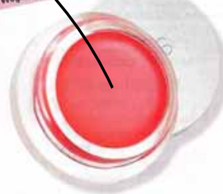
3. Węgalski róż w kremie Lip2Cheek Smile RMS 175 zł