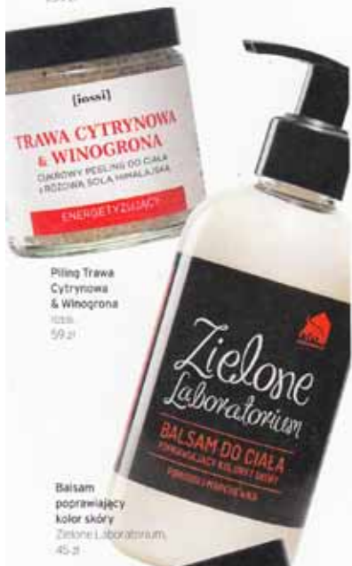
Piling Trawa Cytrynowa & Winogrona Iossi, 59 zł