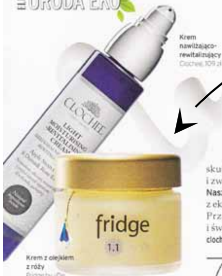
Krem nawilżająco-rewitalizujący Clochee, 109 zł