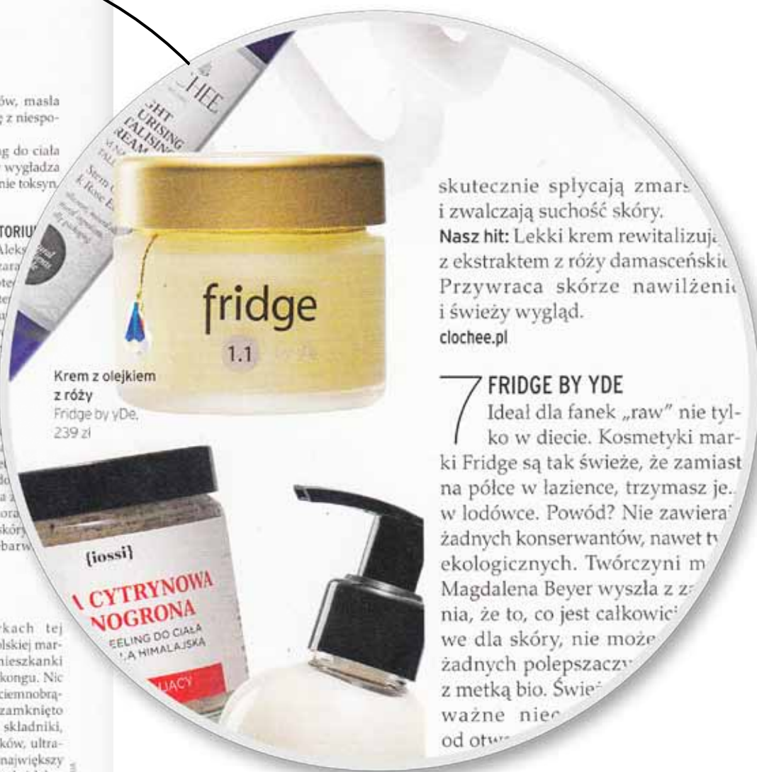
Krem z olejkiem z róży Fridge by YDe, 239 zł

10 W kosmetykach tej marki w 100 proc. polskiej marki zakochały się też mieszkanki Amsterdamu czy Hongkongu. Nic dziwnego, w pięknych, ciemnobrązowych buteleczkach zamknięto całkowicie organiczne składniki, bez silikonów, barwników, ultradelikatne dla skóry. Ich największy atut? Zamiast zwykłej wody ich bazą są wody roślinne, które dodatkowo koją i regenerują skórę. Nasz hit: Silnie nawilżający krem do twarzy, który wycisza zaczerwienienia skóry. phenome.pl