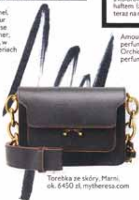
Torebka ze skóry, Marni, ok. 6450 zł, mytheresa.com

Rimmel, Colour Precise Eyeliner, 27 zł, w drogeriach