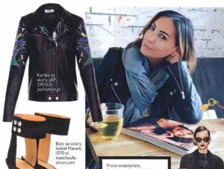
Kurtka ze skóry, JAP, 2900 zł, japofashion.pl